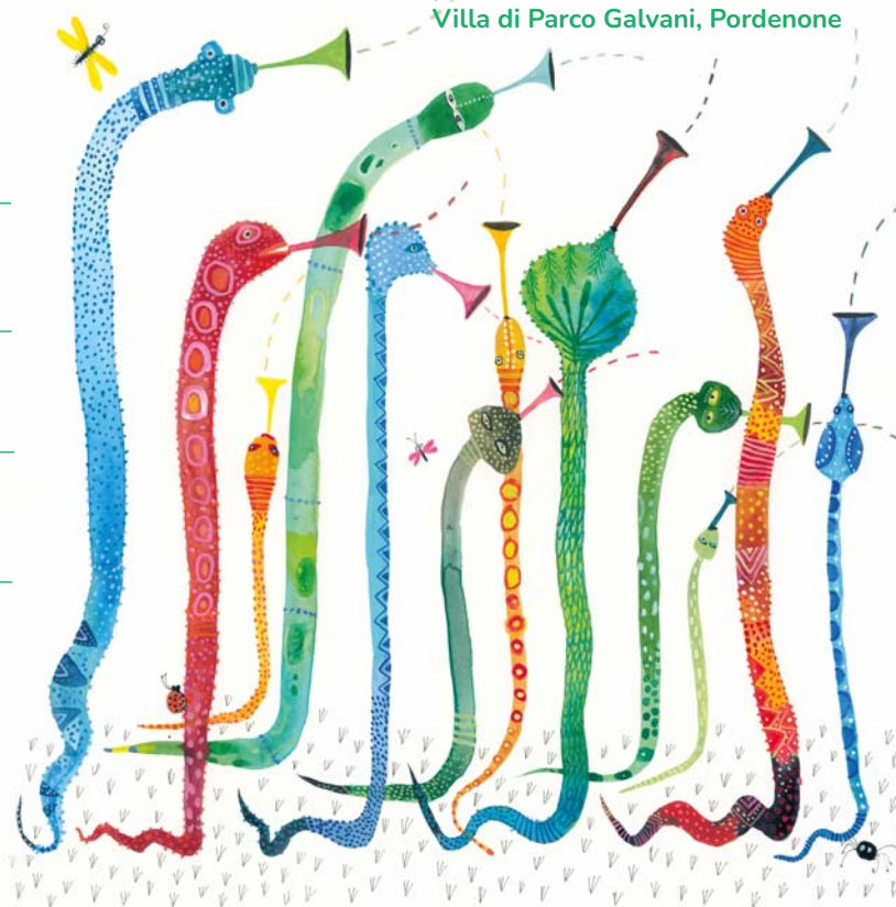
Illustrazione di Piet Grobler If pigs could swim and fish could fly, 2024)

presso Palazzo del Fumetto Villa di Parco Galvani, Pordenone