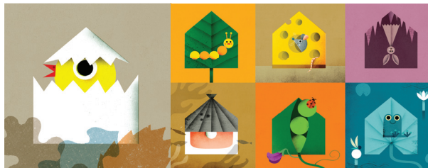
Illustrazione di Philip Giordano, C'est ma maison , Milan 2017

Chi si nasconde tra le forme? | 5 - 7 anni