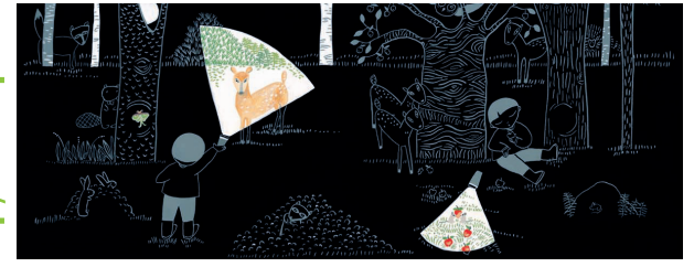
Illustrazione di Lizzy Boyd, Giochi di Luce , Terre di Mezzo 2016