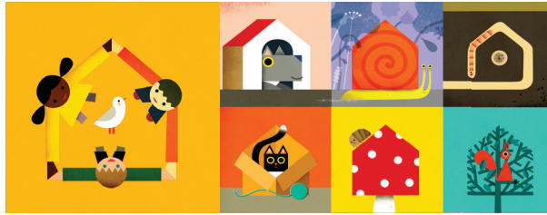
Illustrazione di Philip Giordano, C'est ma maison , Milan 2017

Eco-esploratori alla riscossa | 3-10 anni