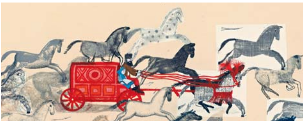
Valerio Vidali, Nel Bosco della Baba Jaga, Fiabe dalla Russia, Franco Cosimo Panini

I racconti della mostra ci guideranno in un viaggio attorno al mondo. Esploriamo in chiave ludica popoli, culture, riti, parole, tradizioni culinarie. Lasciamoci trascinare dai racconti per inventarne altri. Intrecciamo colorati fili di storie, peculiarità, immagini, ricordi lontani di paesi diversi per tessere una tela variopinta e possibile.