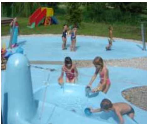
Giardino d’Acqua di Taiedo di Chions Piazza IV Novembre, 5

Il Giardino d’Acqua dell’Asilo Nido di Taiedo di Chions è stato progettato per accogliere l’attività spontanea del bambino nell’incontro con l’elemento “acqua”.